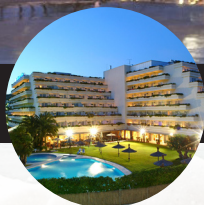
HOTEL MELIÁ SITGES